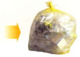
Sacs jaunes translucides de 100l disponibles gratuitement en Mairie