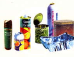
Boîtes de conserve, aérosols, barquettes en acier, aluminium