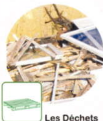
Les Déchets de bois