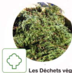
Les Déchets végétaux