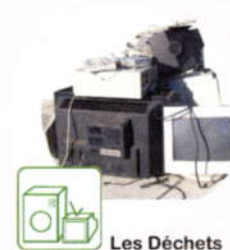
Les Déchets d'équipements électriques et électroniques, l'électroménager

Pensez à venir 15 minutes avant la fermeture !