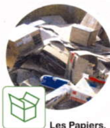
Les Papiers, cartons