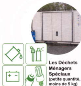
Les Déchets Ménagers Spéciaux (petite quantité, moins de 5 kg)